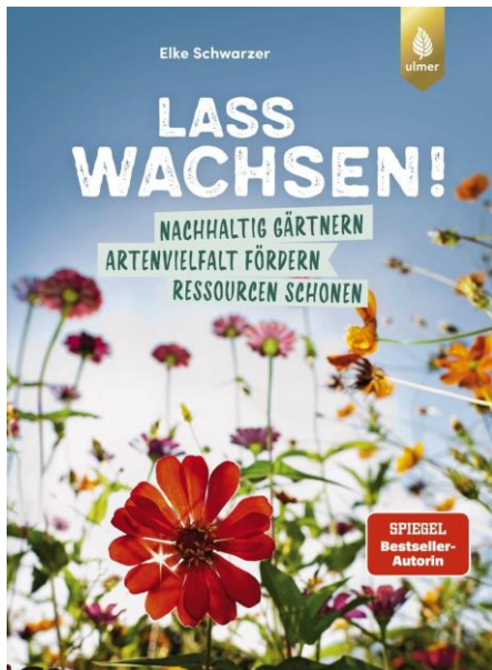
Lass wachsen! 25,00 EUR