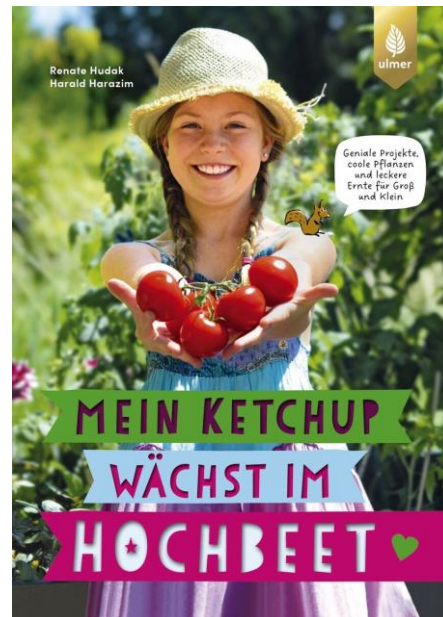
Mein Ketchup wächst im Hochbeet 20,00 EUR